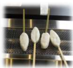
笹かまの手焼きに挑戦!