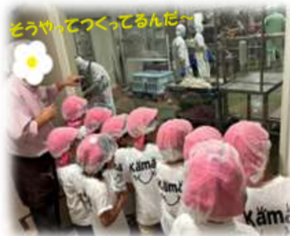
そうやってつくってるんだー