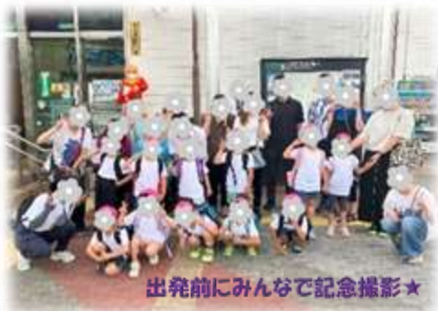
出発前にみんなで記念撮影★