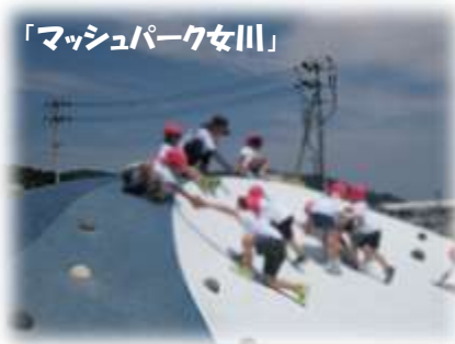
「マッシュパーク女川」