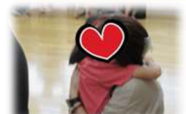
一晩 離れたお家の人との再会