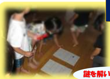
謎を解いて宝物探し