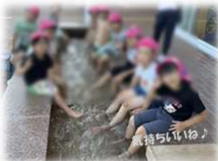
「女川温泉ゆほっぽ」でお風呂 足湯にもはいたよ