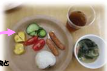
朝食には作っておいだきゅうりの漬物と みそ玉を出し汁で薄め食べました