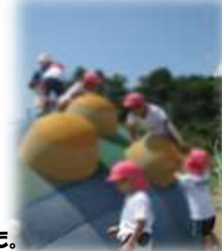
大はしゃぎの子ども達! たくさん体を動かして遊びました。