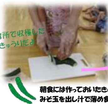
保育所で収穫した きゅうりだよ