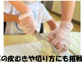
野菜の皮むきや切り方にも挑戦！