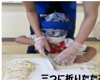
三つに折りたたみ、包丁で切ると うどんの出来上がり！